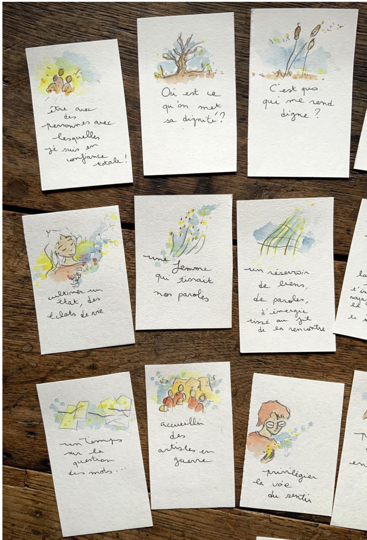
Les planches sensibles de Stéphanie Doucet