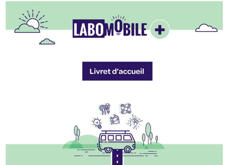
Lancement de l'accompagnement Octobre 2020