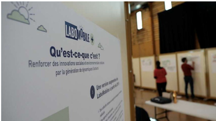
Des réunions de travail pendant plusieurs mois avec les collectifs