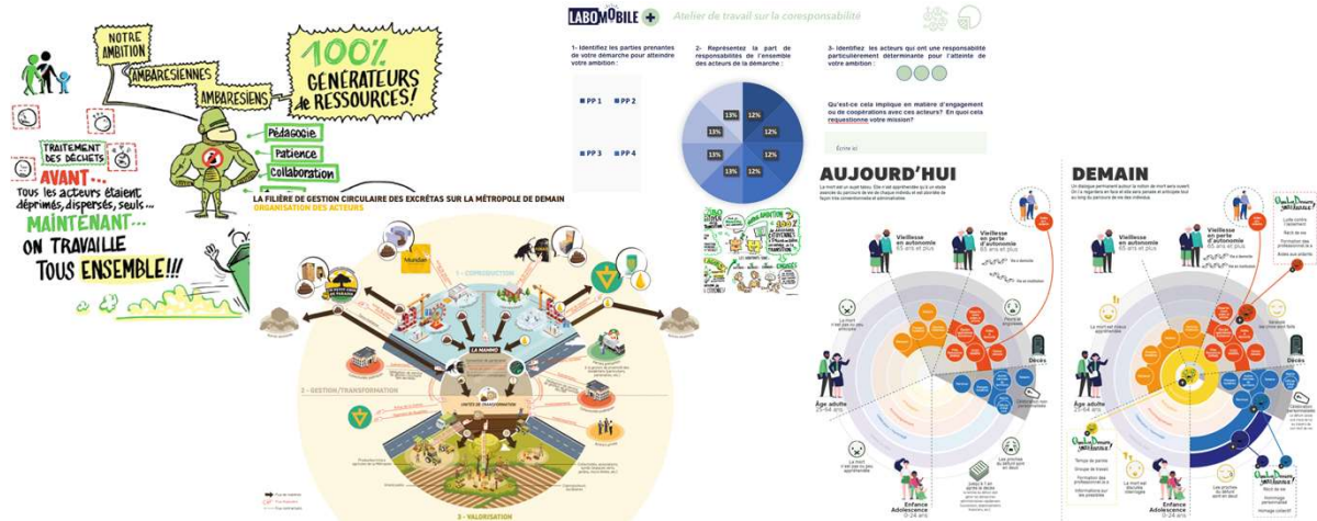
Une multitude de supports et illustrations à l'usage des collectifs