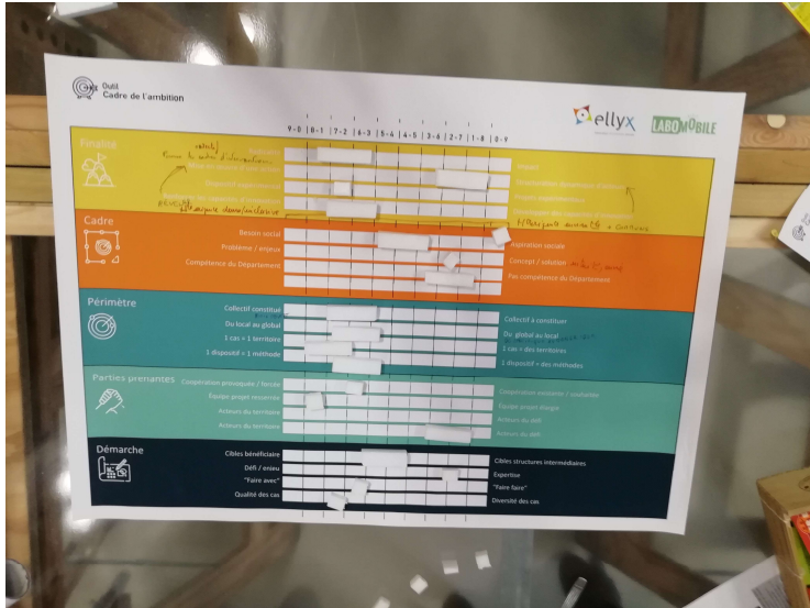
Travail sur le cadre d'ambition des Labo'Mobiles - Septembre 2019

Des supports de réflexion durant la phase de consolidation du collectif